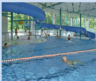
▼ Aquapark v Horaždovicích

▲ Klášter Zlatá koruna je pokládán za jeden z nejčtenějších komplexů gotické architektury ve střední Evropě. Otevřeno mimo pondělí.