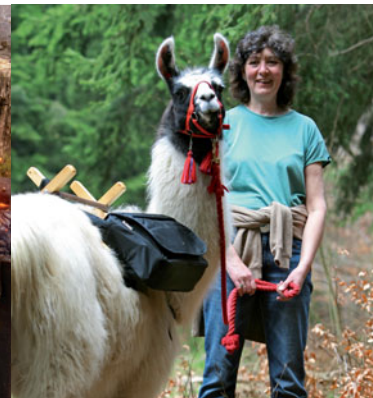
▼ Lamy si pohladíte v bavorském Sickingu i šumavském Kolinci

stěnu se skluzavkou nebo trampolínou. Interaktivní expozice a dětské koutek najdete v infocentrech Národního parku Šumava v Kvildě a Kašperských Horách.