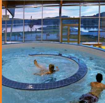
▲ Aquapark Lipno nad Vltavou

Koupání pod střechou najdete i v bazénu ve Větrní, Volarech, Prachaticích, Klatovech a Domažlicích.