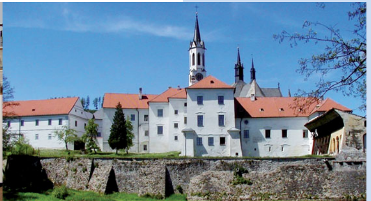
▼ Cisterciácký klášter ve Vyšším Brodě

Hrady a zámky jsou živou učebnicí architektury. Rozjeďte se proto na české straně do Velhartic, na Rabí, Kašperk, do Českého Krumlova a Rožmberku, ale i do Švihova nebo Horšovského Týna, prohlédnout si, co vše zůstalo po jejich pánech a vladařích.