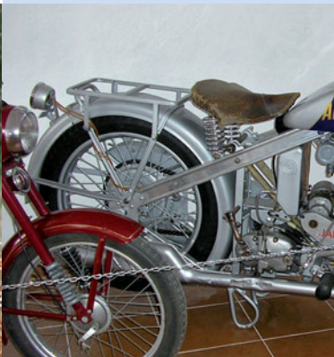
▼ Muzeum historických motocyklů najdete dvakrát – v Zelezném Rudě a Kašperských Horách

▲ S rozsáhlou přírodou Bavorského lesa a Šumavy se lze seznámit v mnoha informačních centrech.