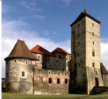
▲ Hrad Švihov

prohánějí stará plemena domácích zvířat. Hrnčířský kruh vyzkouší vaší zručnost. Zkusíte si upéct chleba, vytvořit něco z cínu, namíchat čarovný nápoj. Pokud se vám v atmosféře našich babiček zalíbí, můžete tu nejen přespát, ale pobýt i několik dnů. Třeba se zrovna stre-fíte do Beltaine či do termínu jiné keltské slavnosti.